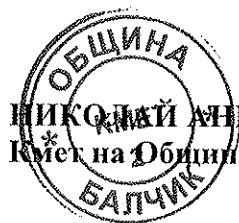
НИКОЛАЙ АНГЕЛОВ Кмет на Община Балчик